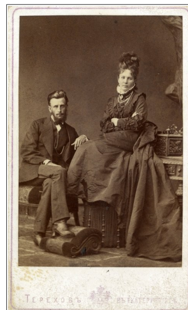
Рис. 3. Семейная пара. 1880-е гг.

Преобладающим цветом мужских костюмов являлся темный с различными оттенками. Выходные костюмы шили только черные. Фактура материалов была главным образом