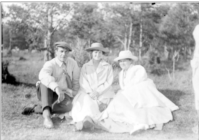
Рис. 8. Горожане на отдыхе.

Другой важной особенностью являлось наличие в одежде горожан различных культурных компонентов, обусловленных региональными традициями. Это объяснялось высоким удельным весом мигрантов издалека в составе жителей города. В конце XIX в. лишь 40 % горожан родились в Екатеринбурге или Екатеринбургском уезде 39 . И универсалистские тенденции не смогли еще в полной мере нивелировать региональные различия в одежде. Хотя эти взаимопроникновения различных этнокультурных комплексов и создавали уральский вариант городского костюма, следует отметить, что процесс перехода к новому буржуазному образу жизни в рассматриваемый период был не завершен (рис. 9).