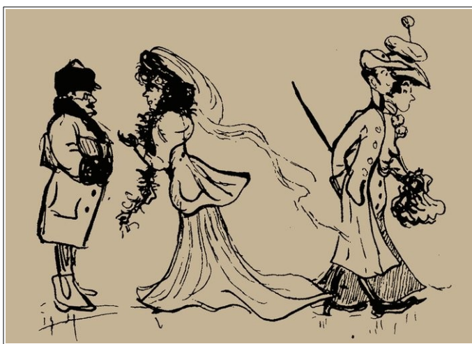
Рис. 9. Зарисовка с улицы. Тихачек М.И. Екатеринбург в лицах: из альбома Маргариты Тихачек. Свердловск, 1983