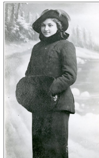
Рис. 6. Молодая дама с муфтой. ГАСО. 01 Р2757 1 42 18.