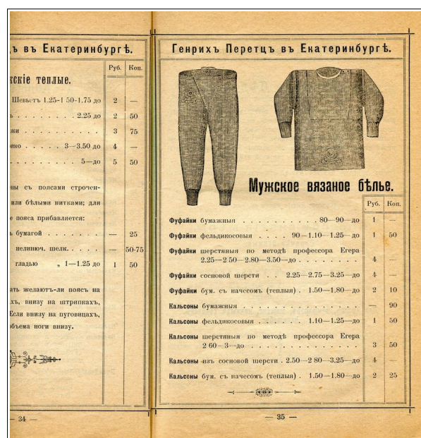
Рис. 7. Каталог товаров торгового дома Г. Перетца. 1908. Частная коллекция

Традицию домашнего изготовления одежды поддерживало появление и распространение швейных машин. Это как минимум облегчало и убыстряло проведение различных