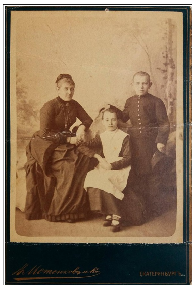
Рис. 2. Семья. Фото В. Метенкова. Начало XX в. Музей истории Екатеринбурга

Даже гимназисты ходили в форменной одежде. Она состояла из гимнастерки или однобортной куртки, брюк, ремня с пряжкой, фуражки. Летом гимназисты надевали белые блузы из коломянки, схожие с теми, что носили кадеты 4 . В Екатеринбурге гимназисты носили темно-синие однобортные мундиры. По борту было пришито 9 гладких посеребренных пуговиц. По скошенному стоячему воротнику шел узкий серебряный галун. Шаровары шились из темно-синего сукна. Двубортное пальто было серого цвета с темно-синими петлицами. После 1905 г. появились черные гимнастерки с серебряными пуговицами 5 . Демократизация жизни после первой русской революции оказала влияние