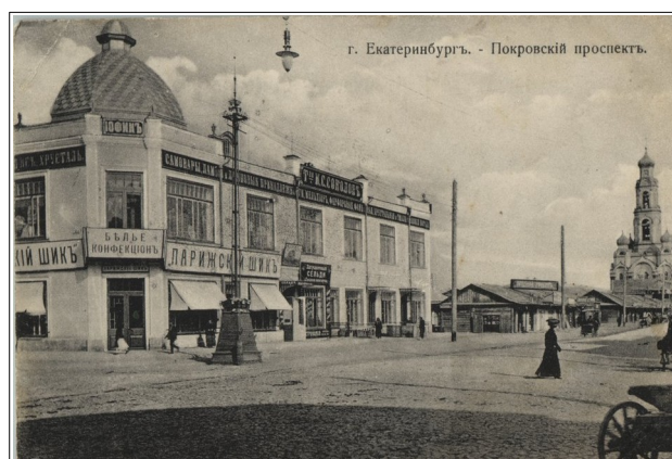
Рис. 4. Открытка.

И все эти предметы были главным образом фабричного изготовления. Они продавались в специализированных магазинах, торговавших одеждой и сопутствующими аксессуарами. Так, на углу Успенской и Покровского проспекта располагался магазин купца И.С. Соколова «Парижский шик», филиал Санкт-Петербургской фирмы, предлагавший покупателям как российские, так и импортные французские товары – белье и конфекцион (рис. 4).